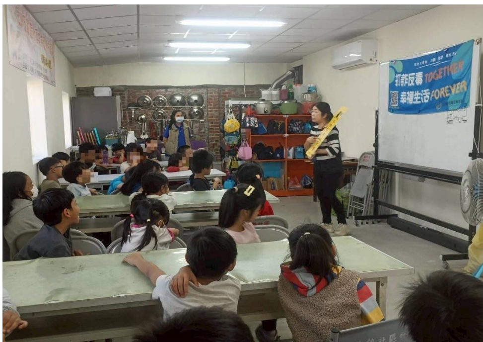
課後安親輔導-打詐反毒宣導