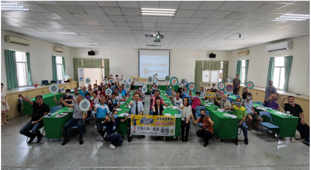
張檢察長（中間）帶領本署社會勞動、義務勞務機構反賄選誓師。