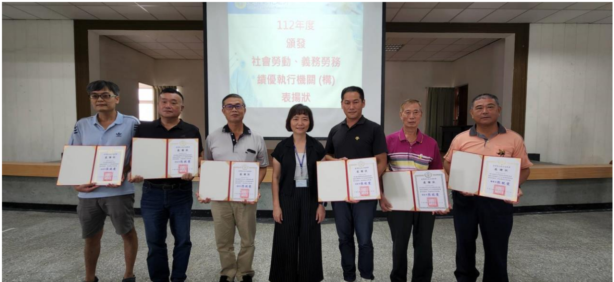
張檢察長頒發獎狀給社會勞動、義務勞務績優執行機（關）構。