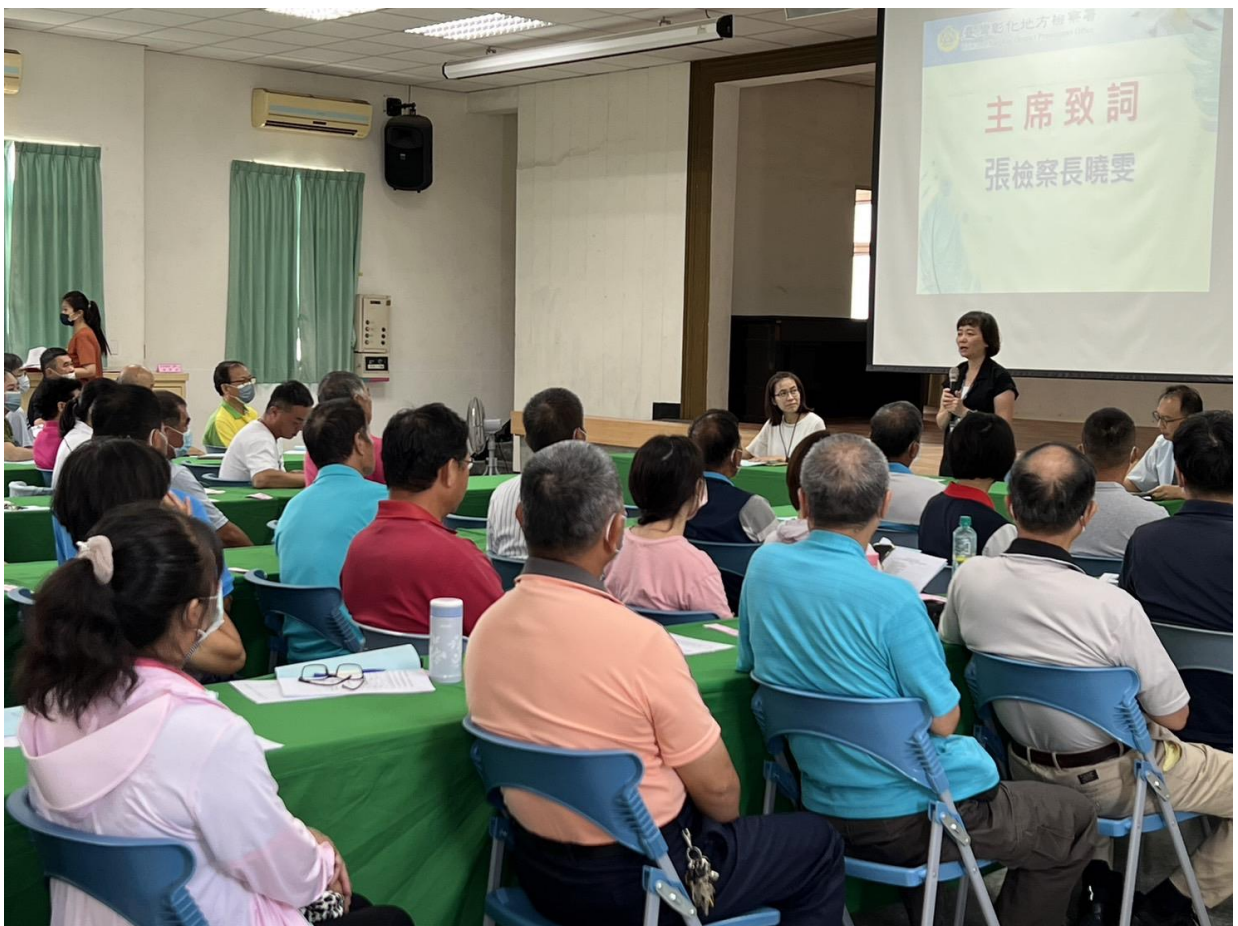
張檢察長肯定與會機構共同推動社會勞動相關業務，讓社會勞動人能兼顧家庭、生活及工作，創造國家、社會及勞動人三贏效益。