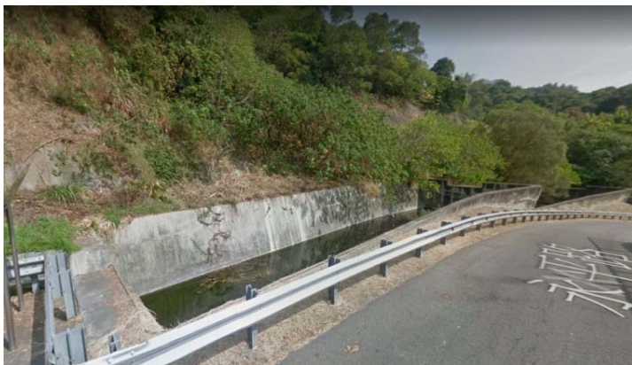
圖：吳主任所指的沉沙池

103年12月間，國內爆發毒豆乾案件，知名豆乾品牌德昌豆乾在香港被衛生單位驗出含有「二甲基黃」成分，二甲基黃是一種