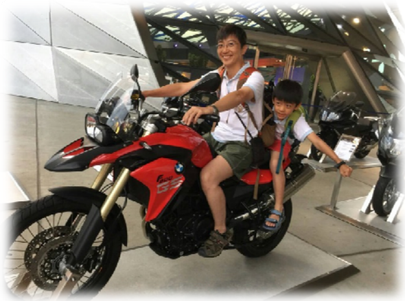
本署前主任檢察官林彥良

林彥良主任檢察官於頂新案時任職本署民生小組主任檢察官(現為臺中地方檢察署主任檢察官)，除參與本案之偵查計畫擬定及實施搜索外，因其曾調部辦事，擔任國際及兩岸法律司檢察官，且於屏東地方檢察署擔任主任檢察官期間，參與「廣大興」案赴菲律賓調查事宜，故嫻熟國際司法互助及取證業務，是林彥良主任在頂新案審理期間對有關至越南取證過程印象深刻，以下為其專訪內容：