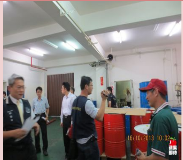
大統公司現場一隅