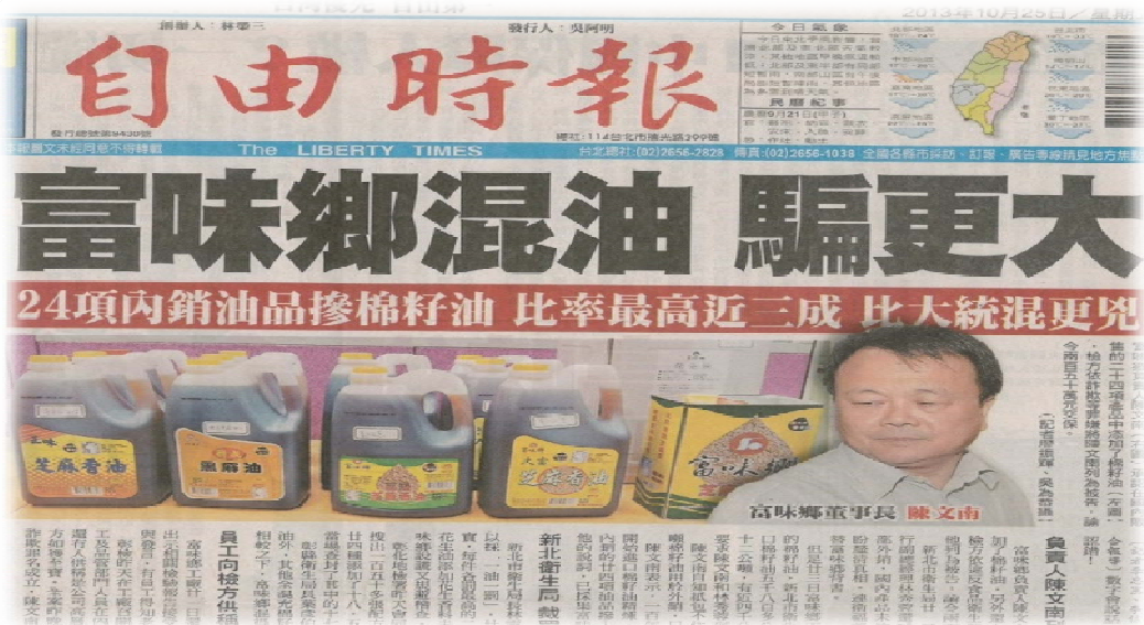
自由時報報載資料

備、製造流程等，有相當的專業判斷能力。但問題在於衛生局人員未受有偵查技能，所以在稽查過程中遇到廠商隱匿事證或故為不實陳述，會難以突破。而檢察官雖具有專業偵查技巧，但對於食品公司的製造流程、食品管制法規未必熟悉。本案係透過檢察官與衛生局聯合行動，在搜索同時請衛生局專業人員進行同步稽查，才能有效率的在第一時間釐清事證。