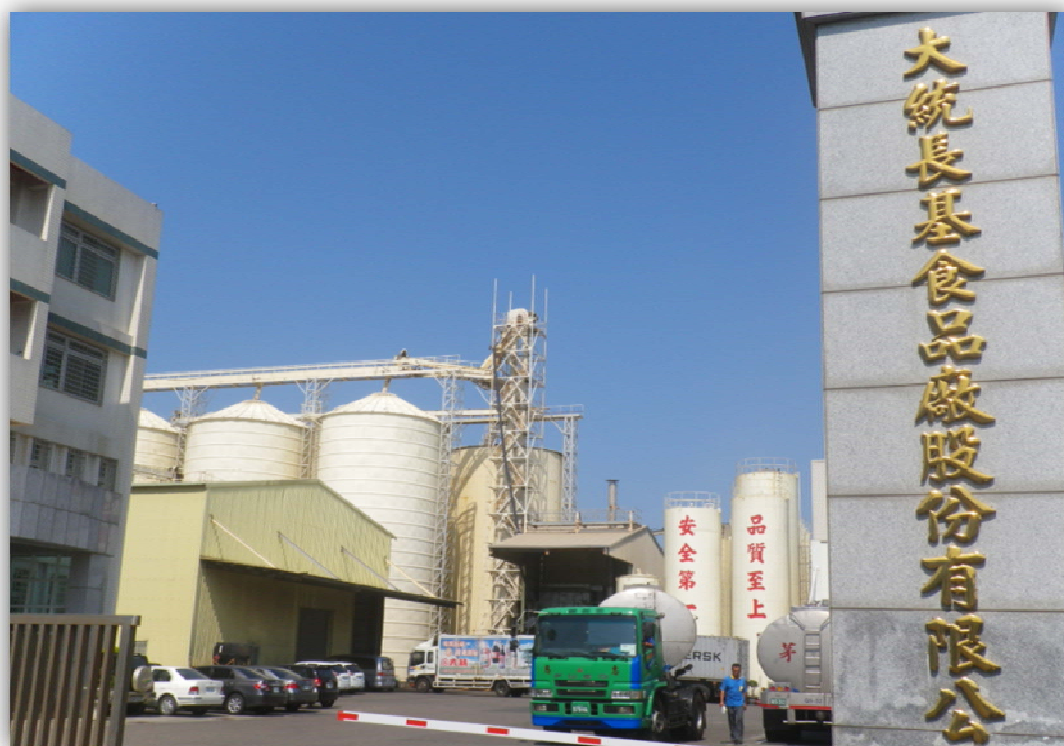
查緝現場照片資料

時間回到101年10月間，一位神秘的檢舉人以電話先後向彰化縣衛生局與臺北市政府衛生局檢舉，指大統公司的「一〇〇%特級橄欖油」成分不純，疑有混摻其他劣質油品之行為。經衛生機關將油品檢體送原行政院衛